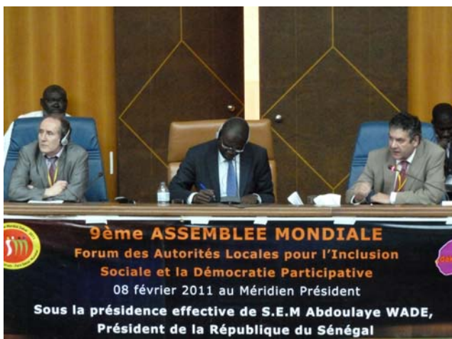
Le dernier Forum des autorités locales à l'occasion du Forum social mondial de Dakar en 2011

La Charte-agenda est une initiative du Forum des autorités locales (FAL) pour l'inclusion sociale et la démocratie participative qui s'est tenu à Caracas en 2006. A la suite de cette réunion, un groupe international d'experts a élaboré un premier projet qui a été débattu et amendé par la suite par des responsables politiques, des universitaires et juristes, et des représentants de la société civile du monde entier avec la contribution du SPIDH Nantes – Pays de la Loire. C'est ce texte, issu d'un large débat participatif, qui doit être adopté à Florence par les instances de CGLU.