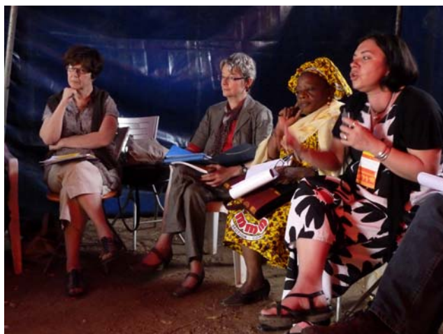
Une Charte née d'un processus citoyen participatif

La Charte a été élaborée par des experts internationaux pour être ratifiée largement par le plus grand nombre de collectivités locales à travers le monde. La Charte-agenda constitue un outil international inédit de promotion et de mise en œuvre des droits de l'Homme à l'échelon local.